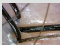
シャンプー&ブラッシング